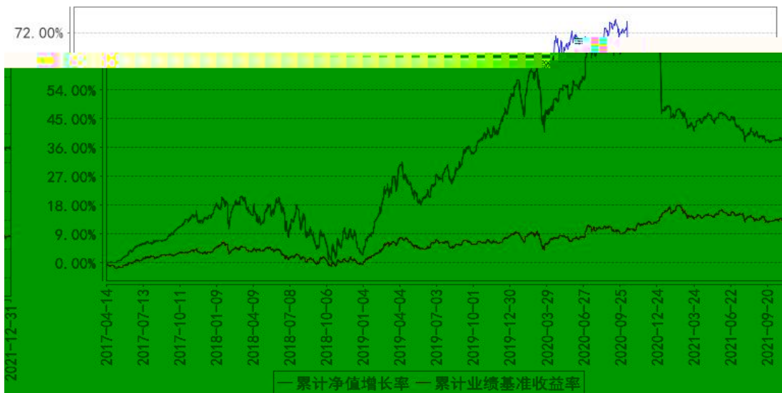
东方红智逸沪港深定开混合累计净值增长率与同期业绩比较基准收益率的历史走势对比图