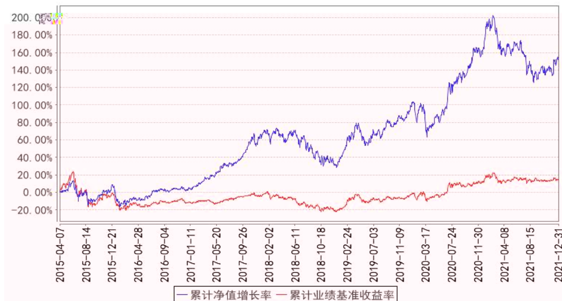
东方红中国优势混合累计净值增长率与同期业绩比较基准收益率的历史走势对比图